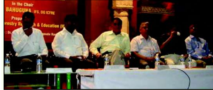
महानिदेशक, भा.वा.अ.शि.प. की अध्यक्षता में हो रही हितधारकों की बैठक

भा.वा.अ.शि.प. ने "कम्परिहेंसिव एन्वायरमेंटल मैनेजमेंट प्लान्स फॉर द माइनिंग इम्पेक्ट जोन" के निर्माण के लिए कर्नाटक के बेल्लारी, चित्रदुर्ग और तुमकुरु