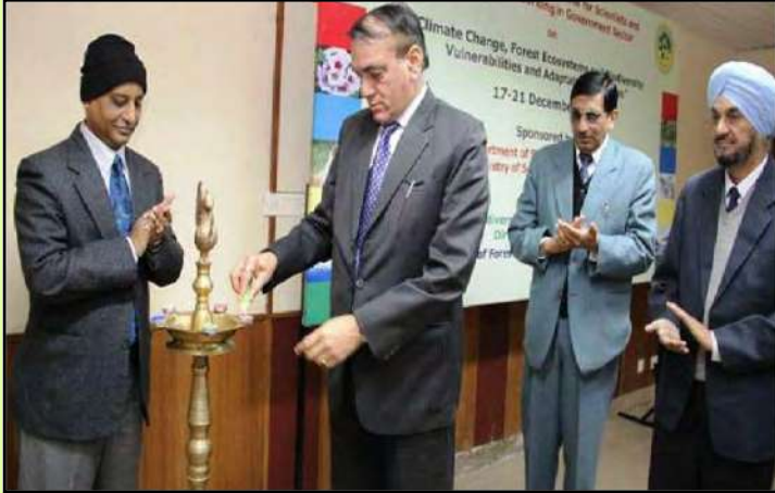
प्रशिक्षण कार्यशाला का उद्घाटन करते महानिदेशक, भा.वा.अ.शि.प.

भा.वा.अ.शि.प. ने दिनांक 17 से 21 दिसम्बर 2012 तक "क्लाइमेट चेंज, फॉरेस्ट इकोसिस्टम एण्ड बायोडाइवर्सिटी: वलनरेबिलिटीज एण्ड एडप्टेशन स्ट्रेटजीज" पर