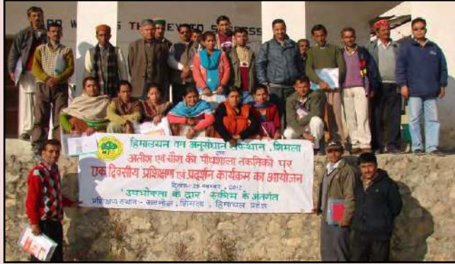
हि.व.अ.सं., शिमला द्वारा हिमाचल प्रदेश में "डायरेक्ट टू कन्ज्यूमर" स्कीम के अंतर्गत एक बैठक का आयोजन

हिमालयन वन अनुसंधान संस्थान, शिमला ने स्थानीय पंचायत के सदस्यों तथा प्रगतिशील किसानों के साथ ग्राम खटनोल, तहसील सुन्नी, जनपद शिमला, हिमाचल प्रदेश में 'डायरेक्ट टू कन्ज्यूमर' स्कीम के अंतर्गत दिनांक 8 सितम्बर 2012 को एक बैठक का आयोजन किया। बैठक के दौरान विभिन्न समशीतोष्ण औषधीय पौधों विशेषकर आतिश, चौरा, कुटकी इत्यादि की खेती पर जानकारी दी गई। संस्थान ने दिनांक 25 नवम्बर 2012 को खटनोल ग्राम में ही आतिश एवं चौरा की पौधशाला तकनीकों पर एक दिवसीय प्रशिक्षण का आयोजन किया जिसमें 25 सहभागियों ने भाग लिया।