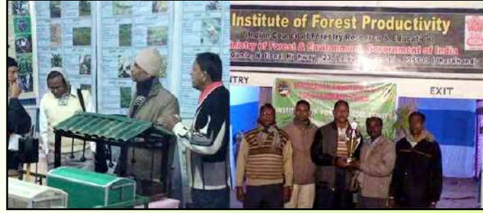
17वें ग्रामीण प्रदर्शन-सह-मेला "सुंदरवन कृष्टि मेला-ओ-लोको संस्कृति उत्सव" में वन उत्पादकता संस्थान, रांची का स्टाल

वन उत्पादकता संस्थान, रांची ने 17वें ग्रामीण प्रदर्शन-सह-मेला "सुंदरवन कृष्टि मेला-ओ-लोको संस्कृति उत्सव" में 20 से 29 दिसम्बर 2012 तक भाग लिया।