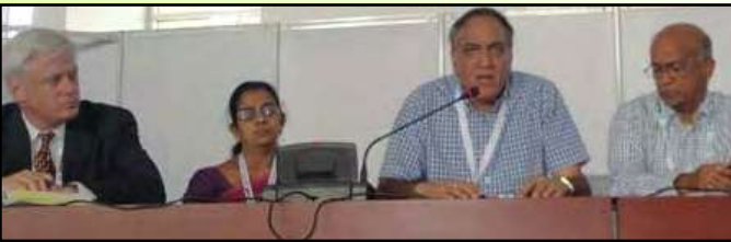
महानिदेशक, भा.वा.अ.शि.प. कॉप-11 में "जलवायु परिवर्तन और जैवविविधता-संरक्षण और अनुकूलन" पर एक सत्र की अध्यक्षता करते हुए