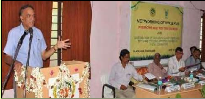
वृक्ष उत्पादकों की संवादात्मक बैठक