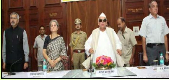
"सस्टेनेबल मैनेजमेंट एण्ड लाइवलीहुड अपोर्चुनिटीज" पर कार्यशाला

वन अनुसंधान संस्थान, देहरादून ने दिनांक 3 और 4 अक्टूबर 2012 को "सस्टेनेबल मैनेजमेंट एण्ड लाइवलीहुड अपोर्चुनिटीज" पर एक कार्यशाला का