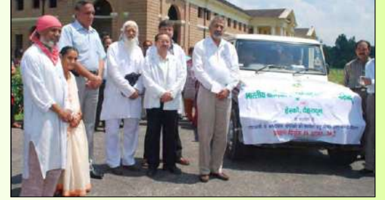
उत्तरकाशी बाढ़ सहायता वाहनों की रवानगी