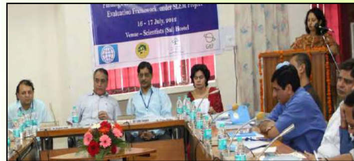
स्लेम परियोजना के अंतर्गत एक संवादात्मक कार्यशाला

भा.वा.अ.शि.प., देहरादून ने स्लेम परियोजना के अंतर्गत एक संवादात्मक कार्यशाला का दिनांक 16 और 17 जुलाई 2012 को आयोजन किया। कार्यशाला में पर्यावरण