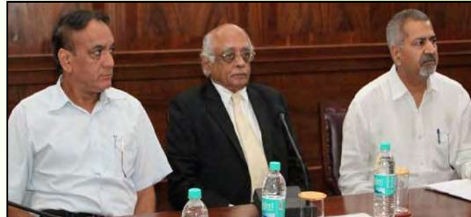
डॉ. आर. चिदम्बरम व.अ.सं., देहरादून में

डॉ. आर. चिदम्बरम, पूर्व निदेशक, भाभा आणविक अनुसंधान केंद्र, प्रधान वैज्ञानिक सलाहकार, भारत सरकार और अध्यक्ष, वैज्ञानिक सलाहकार