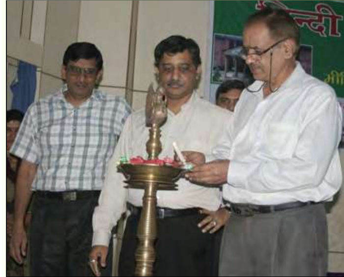
हिन्दी सप्ताह के समापन समारोह के दौरान

भारतीय वानिकी अनुसंधान एवं शिक्षा परिषद्, देहरादून में दिनांक 7 से 14 सितम्बर 2012 को हिन्दी सप्ताह का आयोजन किया गया। इस दौरान