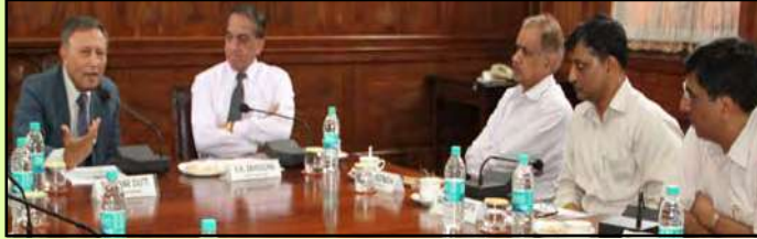
श्री शेखर दत्त, राज्यपाल, छत्तीसगढ़ व.अ.सं., देहरादून में

श्री शेखर दत्त, माननीय राज्यपाल, छत्तीसगढ़ दिनांक 9 अगस्त 2012 को व.अ.सं., देहरादून में पधारे। उन्होंने अकाष्ठ वन उपज के बाजार भाव पर एक