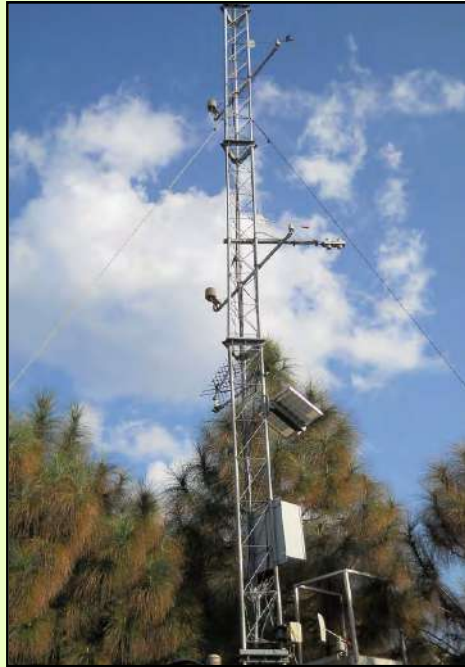
वन अनुसंधान संस्थान, देहरादून में वन मौसमविज्ञानीय स्टेशन (एफ.एम.एस.) टावर

● वन अनुसन्धान संस्थान के प्रयोगात्मक क्षेत्र में वन मौसम विज्ञानीय स्टेशन (एफ.एम.एस.) टावर द्वारा नवोदित चीड़ रोपण में ऊर्जा तथा जल बजट बनाने के लिए आधे घंटे का सूक्ष्म मौसम विज्ञान तथा सहायक आँकड़े का उपयोग करते हुए "जलवायु परिवर्तनशीलता