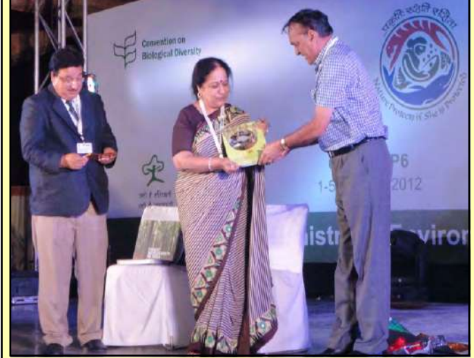
"फॉरेस्ट सेक्टर रिपोर्ट इंडिया 2010" का विमोचन

भा.वा.अ.शि.प. ने भारत की वन जैवविविधता के अद्वितीय कोष को प्रकाश में लाने के उद्देश्य से "फॉरेस्ट बायोडाइवर्सिटी इन इंडिया" के नाम से एक कॉफी टेबल पुस्तक