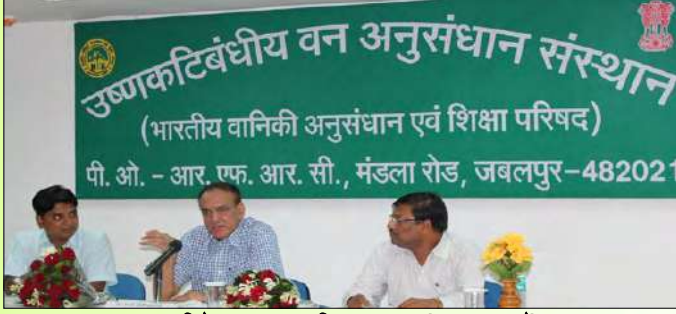
महानिदेशक, भा.वा.अ.शि.प. उ.व.अ.सं., जबलपुर में