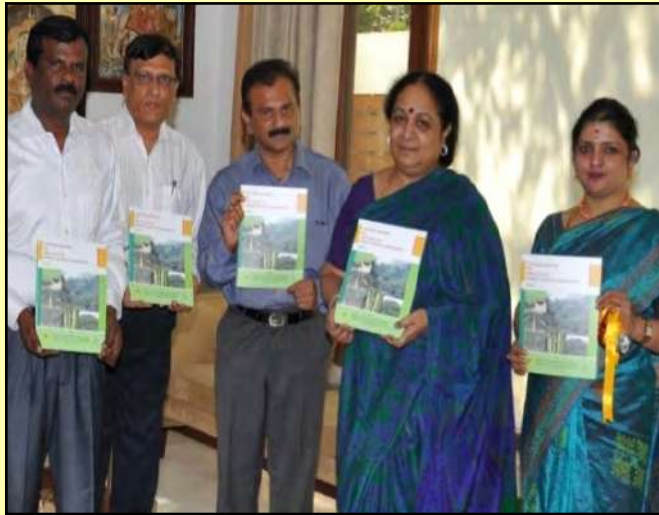
वन आनुवंशिक संसाधनों की स्थिति पर राष्ट्रीय प्रतिवेदन का माननीय पर्यावरण एवं वन मंत्री द्वारा विमोचन

वन आनुवंशिकी एवं वृक्ष प्रजनन संस्थान, कोयम्बटूर द्वारा राष्ट्रीय परामर्शी प्रक्रिया द्वारा वन आनुवंशिक संसाधनों की स्थिति पर राष्ट्रीय प्रतिवेदन