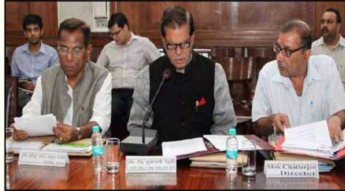
विज्ञान और प्रौद्योगिकी, पर्यावरण एवं वन पर संसदीय समिति व.अ.सं., देहरादून में

विज्ञान और प्रौद्योगिकी, पर्यावरण एवं वन पर संसदीय समिति ने 4 जुलाई 2012 को वन अनुसंधान संस्थान, देहरादून का दौरा किया। समिति के अध्यक्ष