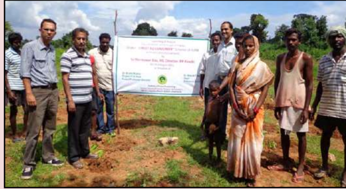
व.उ.सं., रांची द्वारा जीवारी ग्राम, खूंटी जनपद में "डायरेक्ट टू कन्ज्यूमर" स्कीम का शुभारंभ

वन उत्पादकता संस्थान, रांची ने फ्लेमिंजिया सेमियालता के रोपण के द्वारा जीवारी ग्राम, खूंटी जनपद में दिनांक 31 अगस्त 2012 को "डायरेक्ट टू कन्ज्यूमर" स्कीम का शुभारंभ किया।