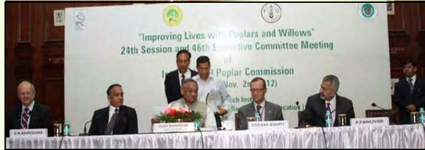
अंतर्राष्ट्रीय पॉपलर आयोग का 24वां सत्र

भारतीय वानिकी अनुसंधान एवं शिक्षा परिषद् एवं वन अनुसंधान संस्थान, देहरादून में अंतर्राष्ट्रीय पॉपलर आयोग का 24वां सत्र एवं उसकी कार्यकारी समिति की 46वीं बैठक अक्टूबर 2012 में आयोजित की गई। आयोजन के पूर्व एवं पश्चात विदेशी प्रतिनिधियों के लिए दौरो का आयोजन किया गया जिनमें उन्हें कृषिवानिकी क्षेत्रों, पौधशालाओं तथा फैक्ट्रियों का भ्रमण कराया गया। आयोजन के दौरान विभिन्न तकनीकी सत्र एक साथ संचालित किए गए। राष्ट्रीय पॉपलर आयोग की बैठक भी इस दौरान आयोजित की गई, जिसमें इसका कार्यक्षेत्र बढ़ाते हुए इसके नाम में परिवर्तन कर इसे "पॉपलर, विलो और अन्य अल्प अवधि फसल राष्ट्रीय आयोग" के नाम से पुनर्नामित कर दिया गया, जिसका सचिवालय वन अनुसंधान संस्थान, देहरादून में होगा। इस आयोजन में 23 देशों के 227 प्रतिनिधियों ने भाग लिया।