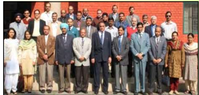
"द सिगनीफिकेंस एण्ड स्कोप ऑफ रेड /रेड प्लस फॉर इंडियाज फॉरेस्ट्स" पर प्रशिक्षण कार्यशाला के सहभागी व आयोजक

भा.वा.अ.शि.प., देहरादून ने दिनांक 7 और 8 नवम्बर 2012 को "द सिगनीफिकेंस एण्ड स्कोप ऑफ रेड /रेड प्लस फॉर इंडियाज फॉरेस्ट्स" पर एक प्रशिक्षण