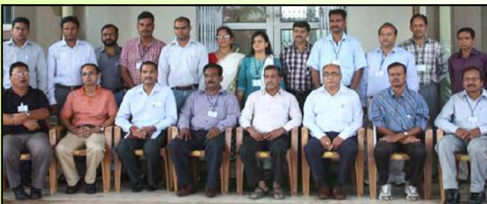
"साइंटिफिक लेक कल्टिवेशन फॉर सस्टेनेबल लाइवलीहुड" पर प्रशिक्षण कार्यक्रम

वन उत्पादकता संस्थान, रांची ने "साइंटिफिक लेक कल्टिवेशन फॉर सस्टेनेबल लाइवलीहुड" पर दिनांक 17 से 19 अगस्त 2012 को भा.वा.अ.शि.प. के वैज्ञानिकों