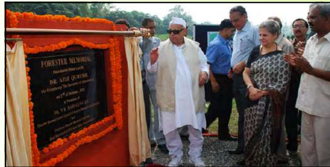
फॉरेस्टरस मेमोरियल का शिलान्यास

वैज्ञानिक वानिकी के इतिहास में वनाधिकारियों के योगदान और बलिदान की याद में वन अनुसंधान संस्थान, देहरादून में एक फॉरेस्टरस मेमोरियल का निर्माण किया जाना है, मेमोरियल का शिलान्यास डॉ. अजीज कुरैशी, माननीय राज्यपाल, उत्तराखण्ड द्वारा दिनांक 3 अक्टूबर 2012 को वन अनुसंधान संस्थान, देहरादून में किया गया।