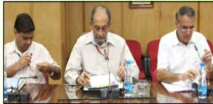
भा.वा.अ.शि.प. के शासक मण्डल की 46वीं बैठक