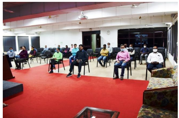
REDD+ कार्यशाला की झलकियां