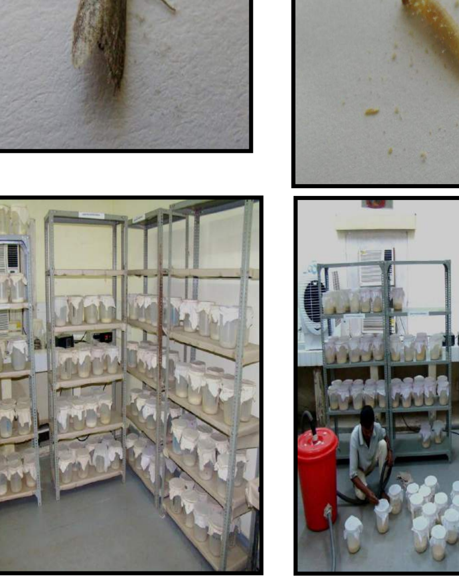
Fig.1. Large scale rearing of rice moth, Corcyra cephalonica in biocontrol laboratory

Phillips, T. (2010). Biological Control of Stored-Product Pests. Midwest Biological Control News, University of Wisconsin. http://www.entomology.wisc.edu/ mbcn/fea210.h