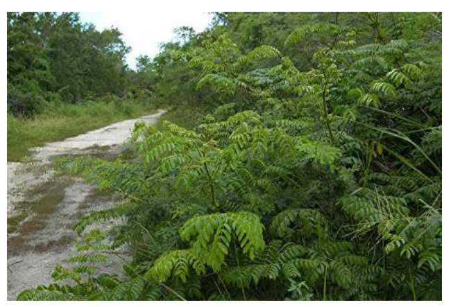
Fig. 2. Green fence of C. bonducella