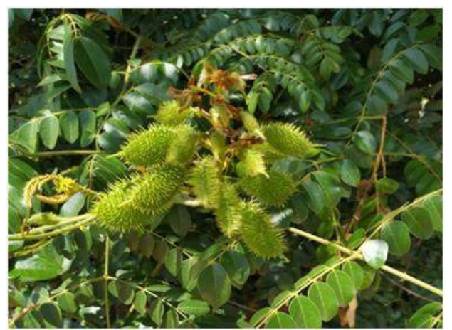
Fig. 1. Pods and Thorny stems of C . bonducella

bondcuella , even though small risks associated with germination and maintenance it is advisable to grow green fence with this woody plant as it provide many medicinal benefits along with Protection.