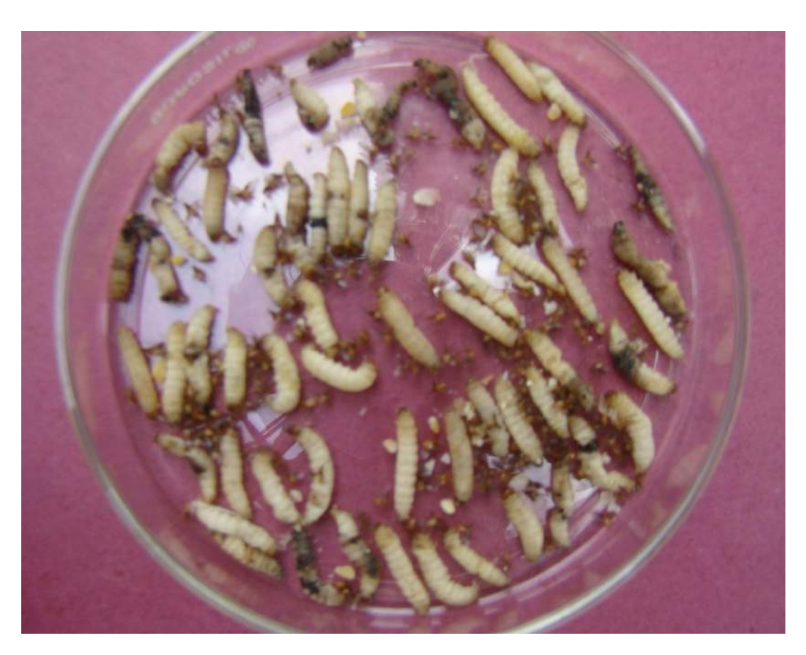
Fig. 3. Massive larval mortality in Corcyra cephalonica due to infestations of ectoparasitoid, Bracon hebetor in biocontrol laboratory