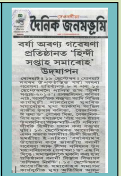
हिन्दी सप्ताह समारोह के संबंध में प्रकाशित समाचार पत्रों के अंश Some News Paper clippings on celebration of Hindi Week