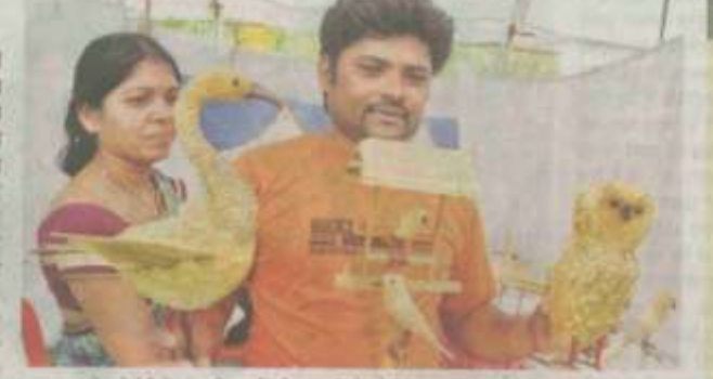
• पुरुषाम में लगे सेने में बारु गी। बनई तुई करनाकृतिये को किवलत कलामिल्वी।

- वास ग्रीन गोल्डाः वांस से सवसे अधिक ऑक्सीलन् निकासादे हे और सम्बन्धे अधिक जावरेन वर्षा अविवयहरू का भी सोखता है। इसी फारण बांस विवे ग्रीम मोल्स भी करत जात है। कर्तमान समय में कॉर्फालंपल उपयोग के चलते कांस को चल गोल्ड भी करा जाता है।