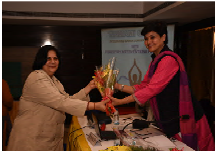
Welcome of guests