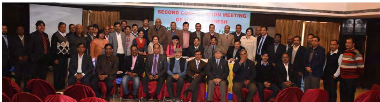
Delegates and participants in 2 nd consultation meeting at Lucknow U.P.