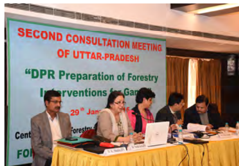
Delegates participating in the meeting