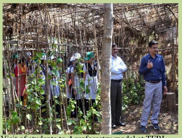
Visit of students to Agroforestry model at TFRI