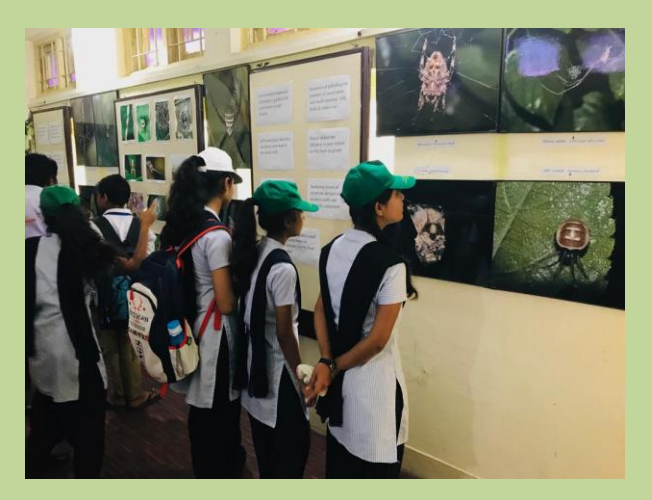
Students visiting NWFP garden and arachnarium on the occasion of International Day of Forests at Tropical Forest Research Institute, Jabalpur