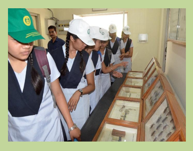
Visit of students to insectory, TFRI