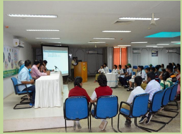
Painting competition and quiz conducted for school students during International Day of Forests at Tropical Forest Research Institute, Jabalpur