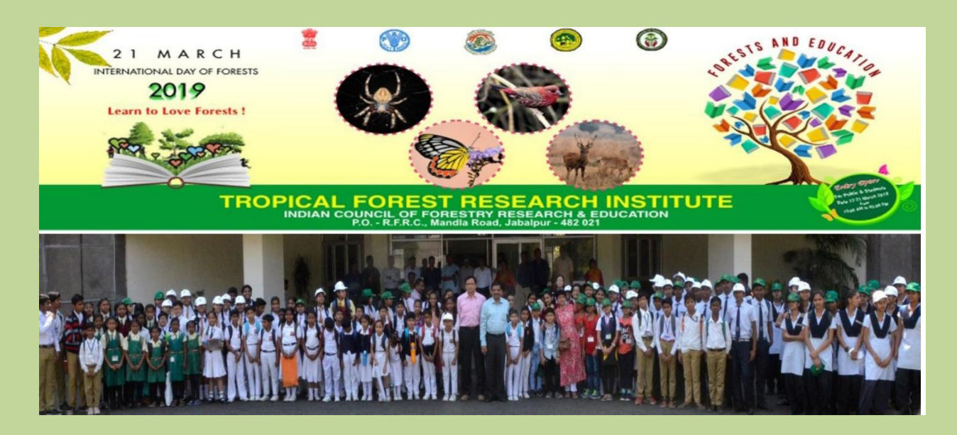
Visit of school students at TFRI during the celebration of International Day of Forests, 2019