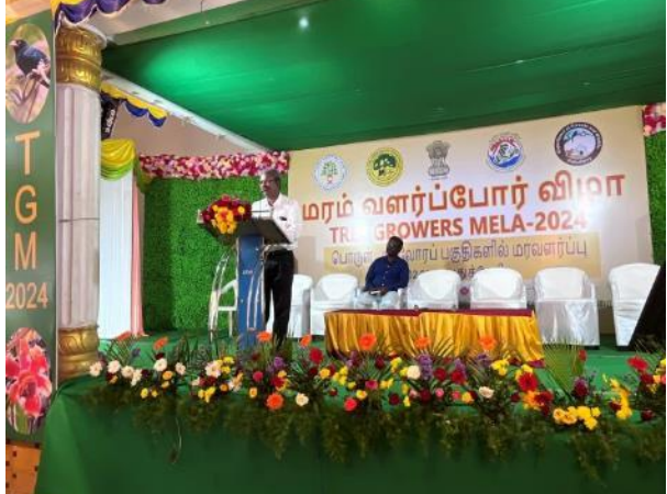
Subject Experts during the Technical session