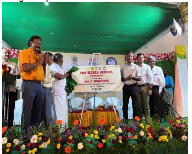
Declaration of VVK-Puducherry