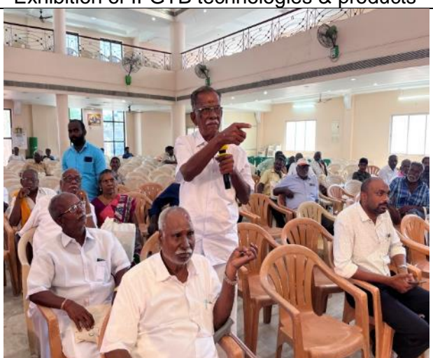
Farmers interaction during the panel discussion