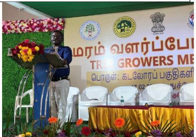
Subject Experts during the Technical session