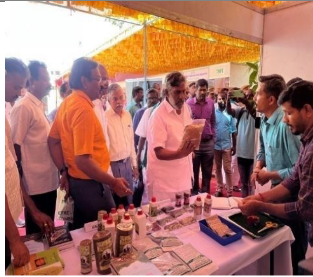
Hon`ble Minister visiting ICFRE-IFGTB Stall