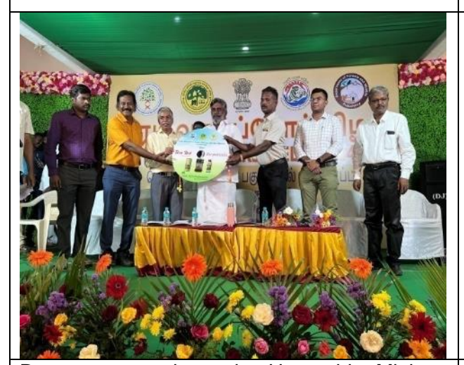
Documentary release by Honorable Minister on 'Bioproducts of ICFRE –IFGTB'