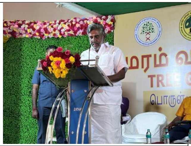
Shri. C. Jayakumar, Hon'ble Minister for Forest & Wildlife, Puducherry during his inaugural speech