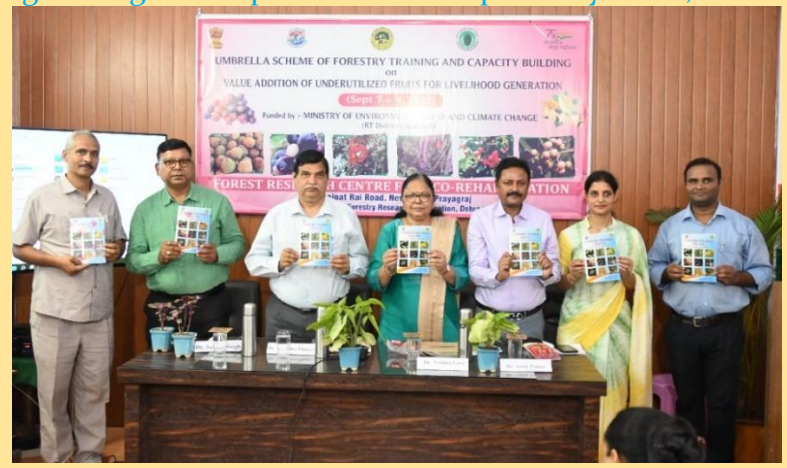
Release of Training Booklet by Chief Guest and other delegates