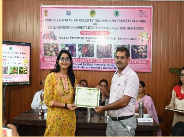
Distribution of Certificates to Trainees of other services