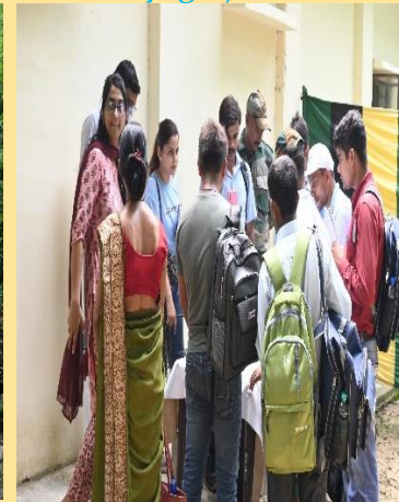
Government Food Science Training Center